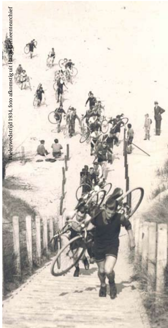
Wielervedstrijd 1934

Het thema van de Dag van de Architectuur is architectuur en mobiliteit. In Den Haag zijn deze dag verschillende gebouwen te bezoeken die een relatie hebben met mobiliteit, zoals de Fokkerterminal, het ANWB-kantoor, Den Haag Nieuw Centraal en de RAC (Rijks Automobiel Centrale)-panden. Daarnaast zijn ook gebouwen als de ministeries van Financiën, VROM en VWS geopend en zetten bewoners van Vroondaal hun deuren open voor bezoekers. Vanuit Vroondaal kan tevens een helikoptervlucht (tegen betaling) over Den Haag gemaakt worden.