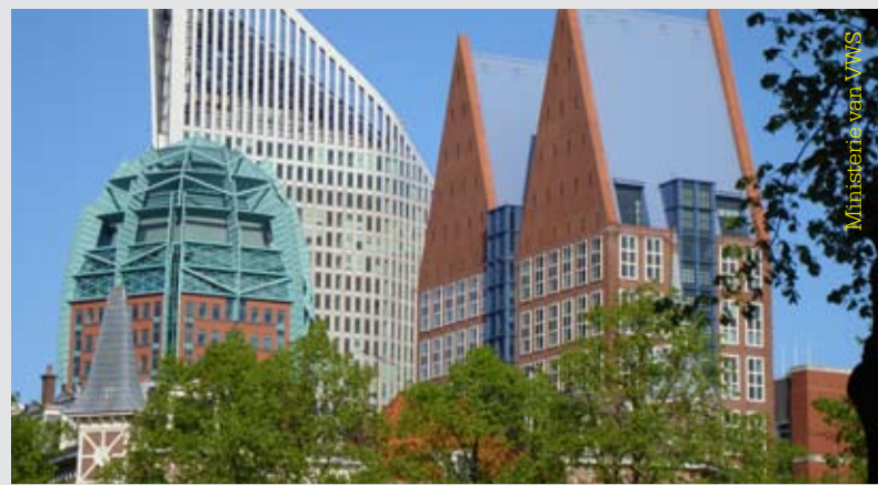
Ministerie van VWS

maar is toch niet saai dankzij de vele variaties. Op de hoek van het gebouw is een grote klok te zien. In de oorlog werd het kantoorgebouw gedeeltelijk gesloopt, maar tussen 1952 en 1954 is het weer hersteld in de oorspronkelijke stijl. Daarnaast werd er in 1954 door de architect C. Kranenburg een tweede verdieping aan het gebouw toegevoegd. Met deze mogelijkheid was bij de bouw in de jaren '20 al rekening gehouden.